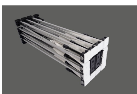
1 - Abra a estrutura.