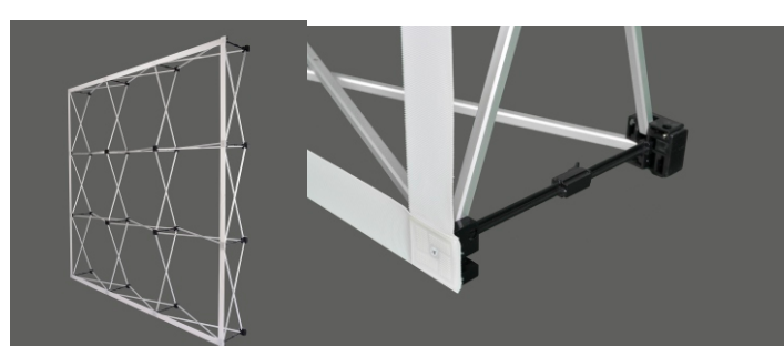
2 - Deixe os alinhadores conforme mostrado na imagem acima.